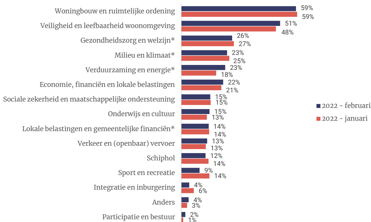
Figuur 1- Wat zouden wat u betreft de drie belangrijkste onderwerpen bij de gemeenteraadsverkiezingen in Haarlemmermeer moeten zijn? Maximaal drie antwoorden.