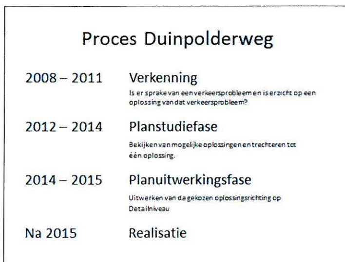
Afbeelding 2: De fasen in het besluitvormingsproces van de Duinpolderweg