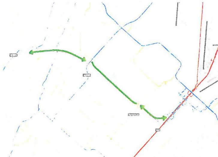
Afbeelding 1: de verschillende tracédelen van de Duinpolderweg

De Duinpolderweg betreft het realiseren van een nieuwe wegverbinding tussen N206 en N205, het verdubbelen van de Nieuwe Bennebroekerweg ten zuiden van Hoofddorp en het realiseren van een 2x2 wegverbinding tussen Spoorlaan en A4. Zie afbeelding 1 voor de verschillende tracédelen. In het besluitvormingsproces van de Duinpolderweg zijn inmiddels al diverse stappen doorlopen. In afbeelding 2 staat een overzicht van de verschillende fasen.